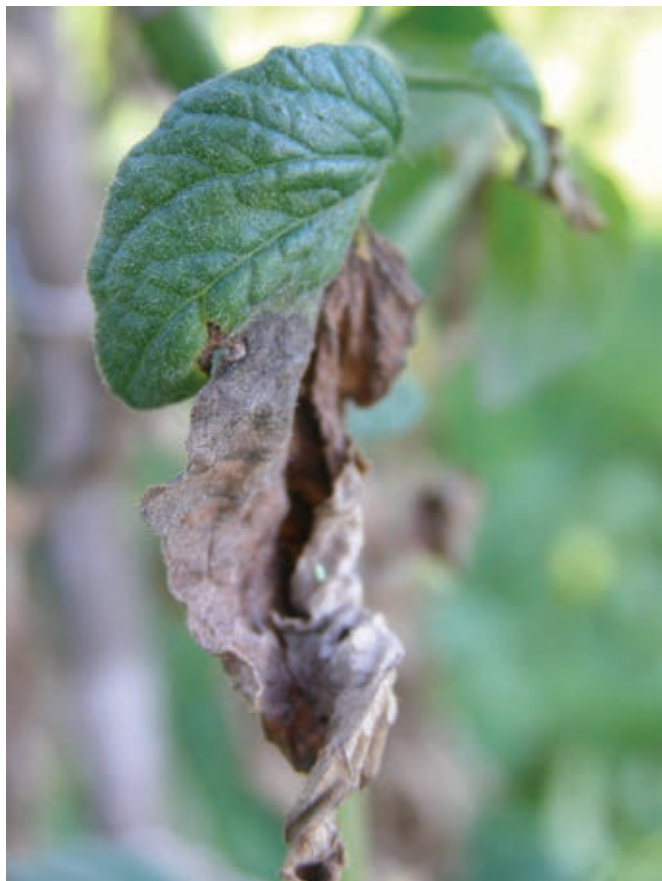
Krompirjeva plesen na paradižniku ...

Po drugi strani pa je volovsko srce, zelo stara sorta, prevzelo srce številnih tako, da ne želijo razmišljati o drugi izbiri. Žal pa imam zanje slabo novico. Volovsko srce je žal najbolj občutljiva sorta, ki jih poznam. To pa ne pomeni, da ga zdaj ne sadite več. Mogoče pa odprite srca še kateri sorti, mogoče hibridu?