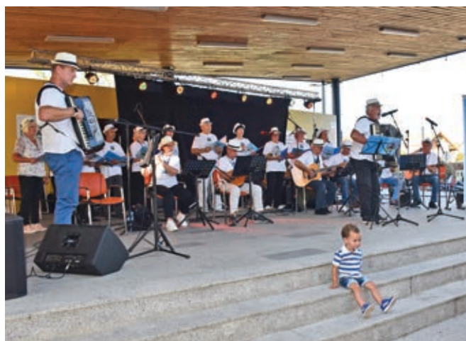
Gostje - ansambel Banjalučki vez ...