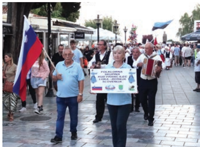
V povorki ...

V soboto, 12. 8. 2023, smo ob 12.50 s sodobnim avtobusom krenili iz Rošnje na dolgo in naporno pot v Ohrid. V skupini nas je bilo 21 plesalk, plesalcev, ljudskih godcev in nekaj spremljevalcev. Pot nas je vodila preko Zagreba, Beograda, Niša, Skopja, Gostivarja in Kumanovega do Ohrida. V Ohrid smo po 17-ih urah vožnje prispeli naslednje jutro okoli 6.00. Utrujeni, a vendar zadovolj-