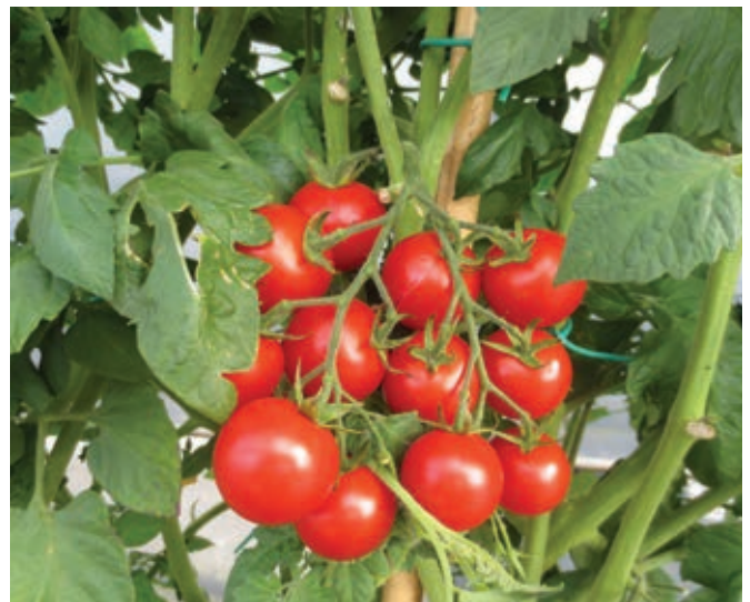
Letos je takšnih prizorov manj kakor lani ...