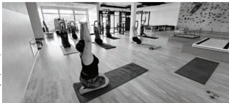
Med vajami smo pozorni na dihanje ...