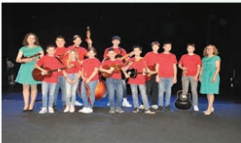
TAMBURAŠKA SKUPINA TRNIČE