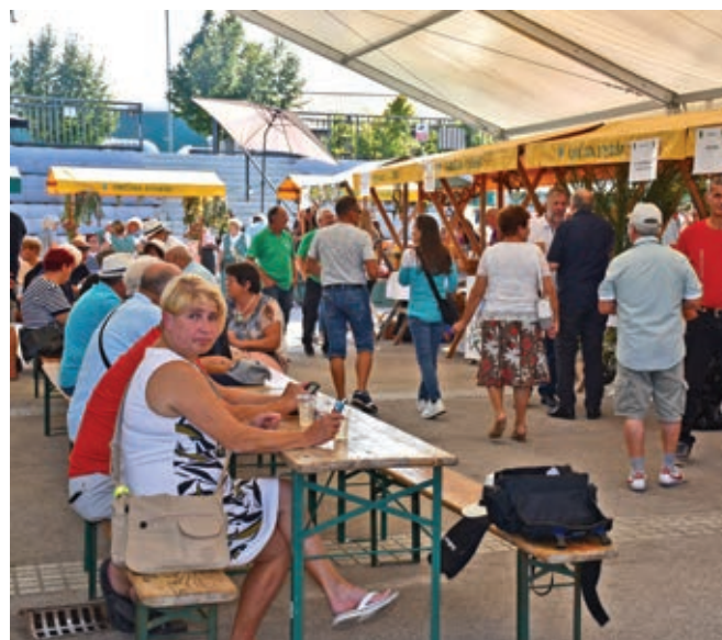
Veselo med stojnicami ...