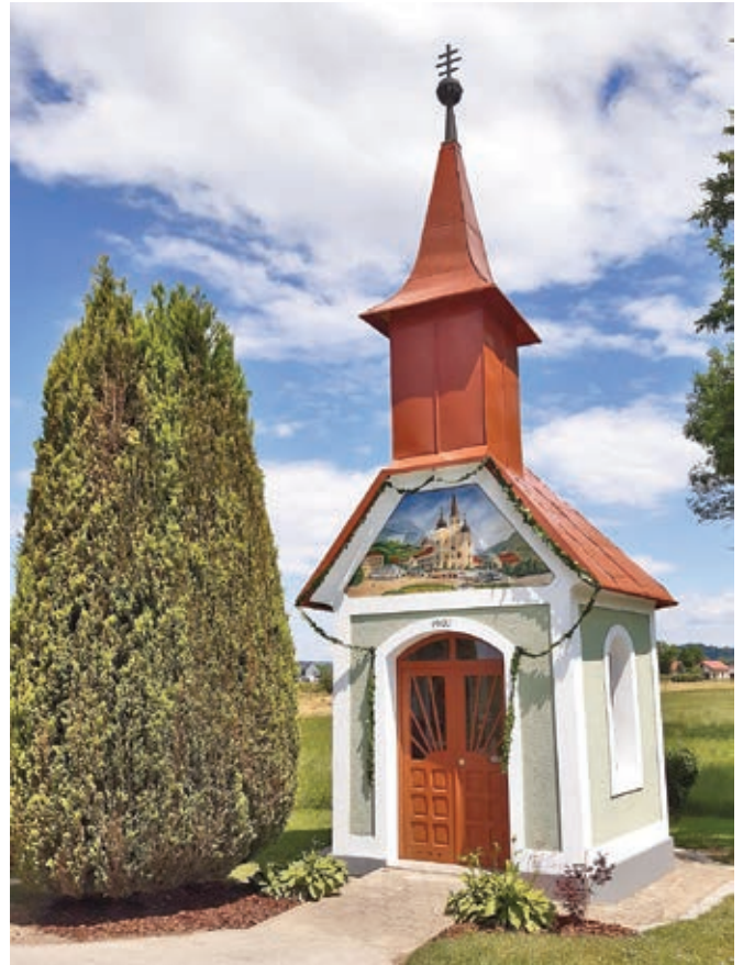
Jokova kapela v Stašah ...

Zelo slovesno je bilo ob 100. obletnici postavitve kapele. Uvod v praznovanje je bilo rodbinsko romanje v Mariazell. Drugo septembrsko soboto pa so se sorodniki še