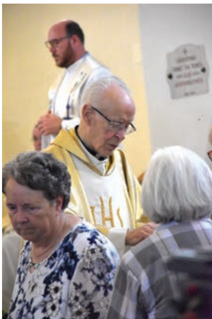
Podeljevanje svete hostije župljanom ...