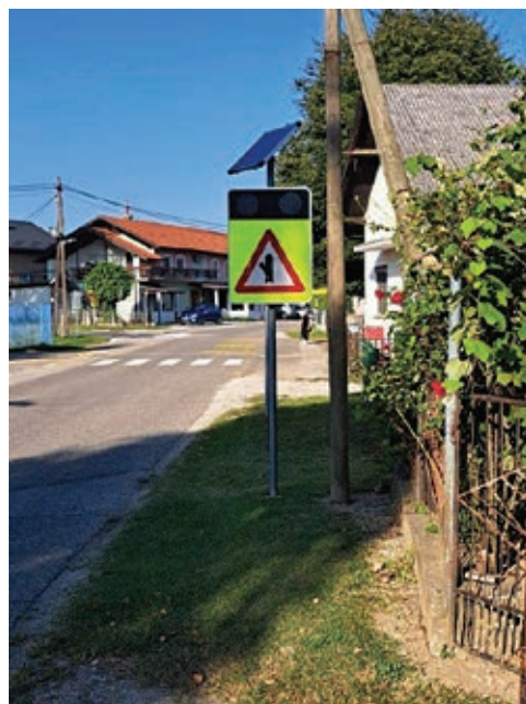
Prometna signalizacija ...