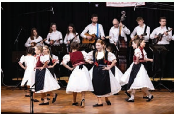
DFS KUU ZVON MALA SUBOTICA