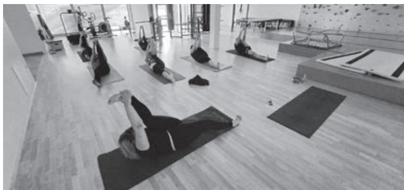
Vodeno raztezanje mišic ...

Človek je edinstveno bitje fluidne narave, zato vsakomur ustreza kaj drugega. To pomeni, da izberemo različne načine gibanja glede na naše počutje, življenjsko obdobje, letni čas, ženski cikel in podobno. Skupinske vadbe torej