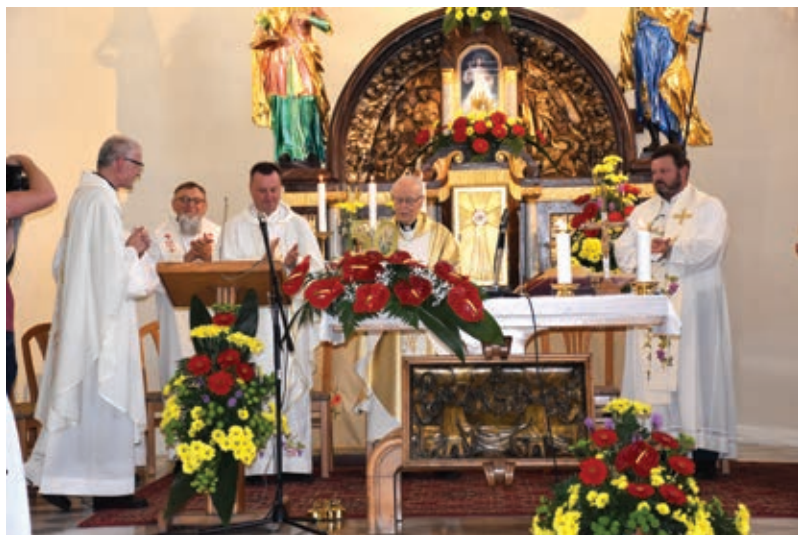
S stanovskimi kolegi - združili moči na svečanosti ...