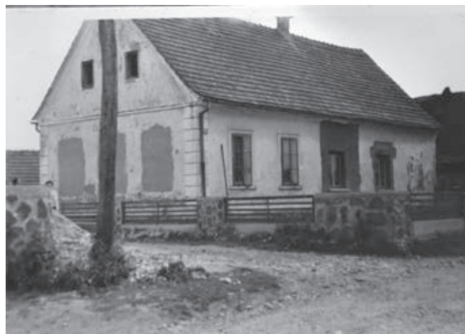
Prva šola v Marjeti ...