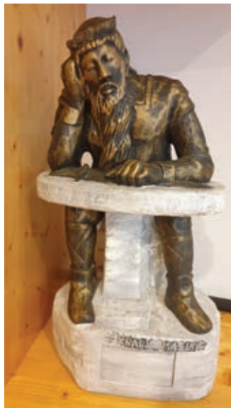
Skulptura kralja Matjaža v kulturnem domu Pliberg ...