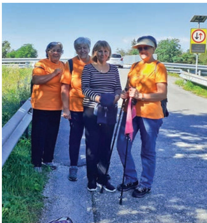
Po kanalu, 11. 8. 2023