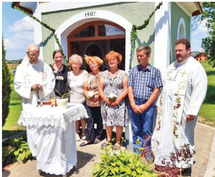
Vnuki in pravnukinja z Anzekove posesti po opravljenem blagoslovu ...