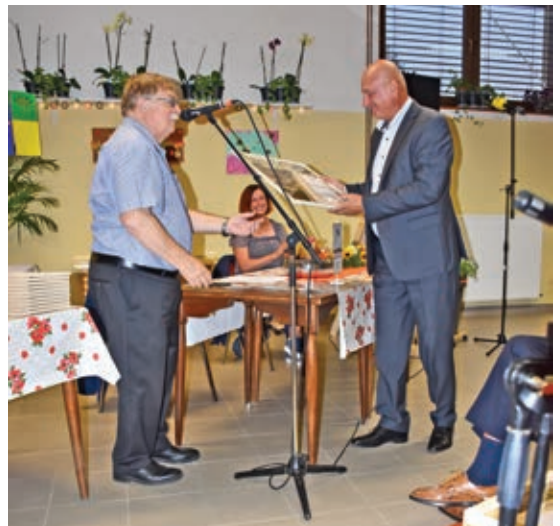
Zahvalo prejela tudi občina - iz rok predsednika društva v županove roke ...