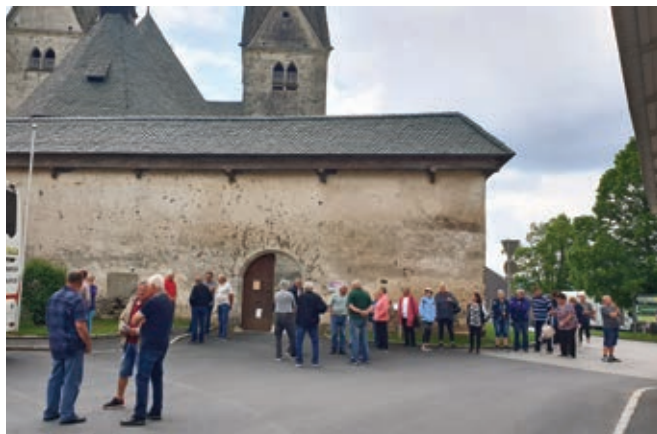
Stolpa in obzidje cerkve Sv. Martina v Djekšah ...

Pot smo nadaljevali na pogorje Svinje planine, kjer je najsevernejša slovenska vas Djekše kot mejno naselje slovenske narodne skupnosti. Ima okrog 800 prebivalcev. V pisnih virih je tukaj župnijska cerkev Sv. Martina iz leta 1168. Prenovljena je bila sredi 18. stoletja v baročnem slogu. Cerkev obdaja protiturški tabor z dvema okroglima stolpoma, z močnim obzidjem z letnico 1535, kot obramba pred Turki. Okrog cerkve je pokopališče, kjer so ohranjeni še mnogi slovenski nagrobni spomeniki. V notranjosti cerkve se nahaja upodobljen križev pot s slovenskimi napisi. Do 1. svetovne vojne je bilo naselje Djekše izrazito slovensko. Po koroškem plebiscitu 1920 pa so občani glasovali s 65 % za ohranitev nedeljene Koroške