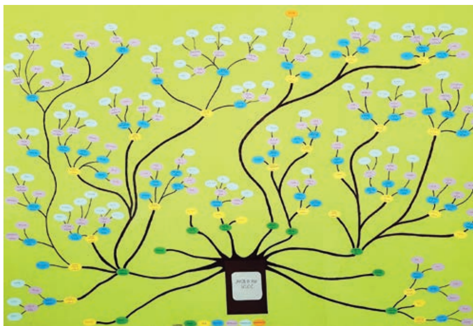
Družinsko drevo ...