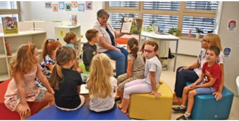
Letošnji prvošolci prvič v šolski knjižnici ...

stile in boš zato lažje nadaljeval. Kratek odmor pripomore tudi k razreševanju problemov. Med odmorom možgani namreč na nezavedni ravni še vedno rešujejo problem, pri tem pa se ne opirajo na predhodne neuspele poskuse.