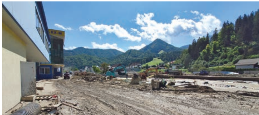
Razdejanje po poplavi ...

Poletni meseci gasilcem po vsej Sloveniji niso prizanašali. Močni sunki vetra, obilne padavine, poplavljanje reke Drave in druge naravne nesreče so tudi nam, gasilcem Gasilske zveze Starše, povzročali mnogo dela in zahtevali naša številna posredovanja.