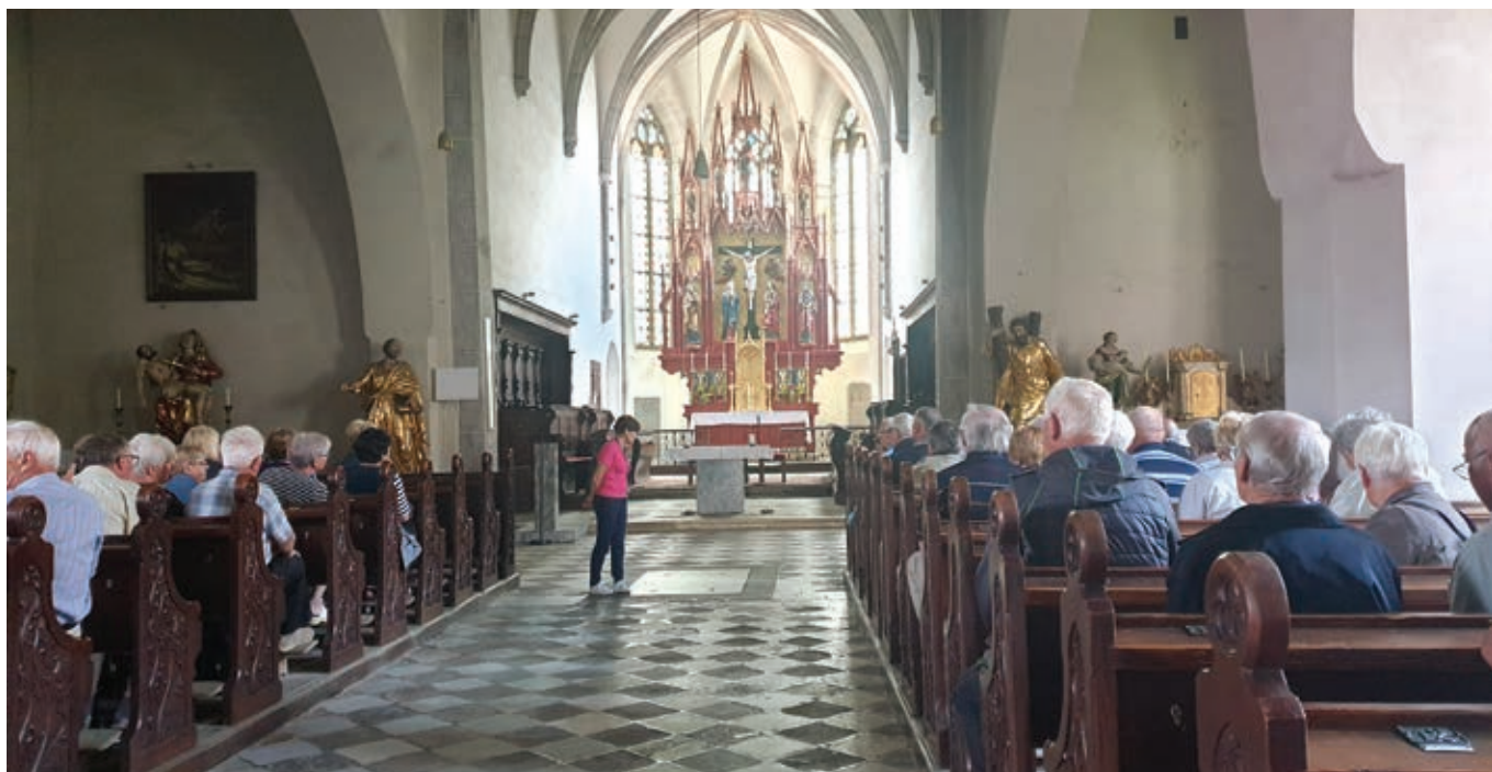
Župnijska cerkev Sv. Adreja v Šent Andražu ...

Sledilo je okusno kosilo v restavraciji v Sloveniji. Ve-