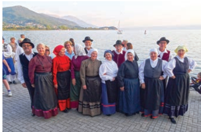
Zadnja fotografija v spomin ...