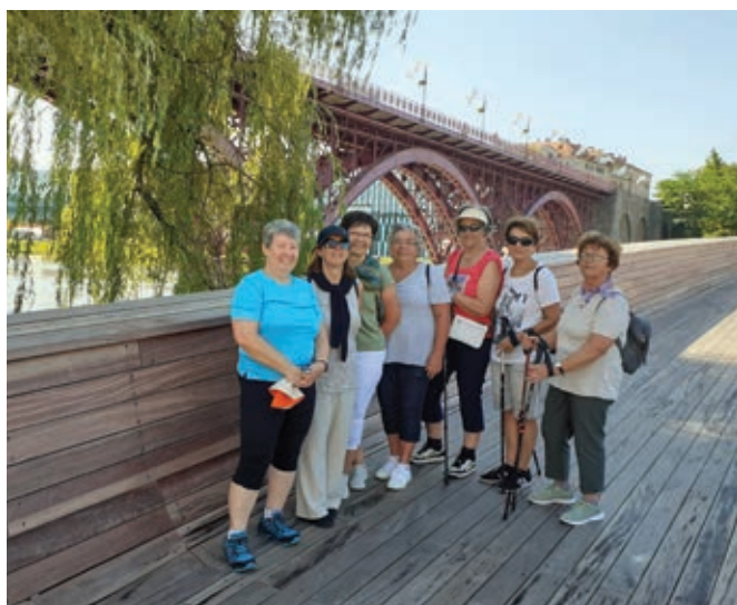
Maribor, 14. 7. 2023

Za prvi poletni pohod smo obiskali Osankarico in uživali na pohorskem zraku ob Črnem jezeru. Ob Račkih ribnikih smo svoja doživetja delili s komarji, ampak ti so nam nagajali tudi doma. Odpeljali smo se v Maribor in se sprehodili ob Dravi, preizkusili smo tudi novo brv. Hladili smo se ob Dravi in dravskem kanalu in se družili s planinci PD Fram. Odkrivali smo floro dravskega kanala.