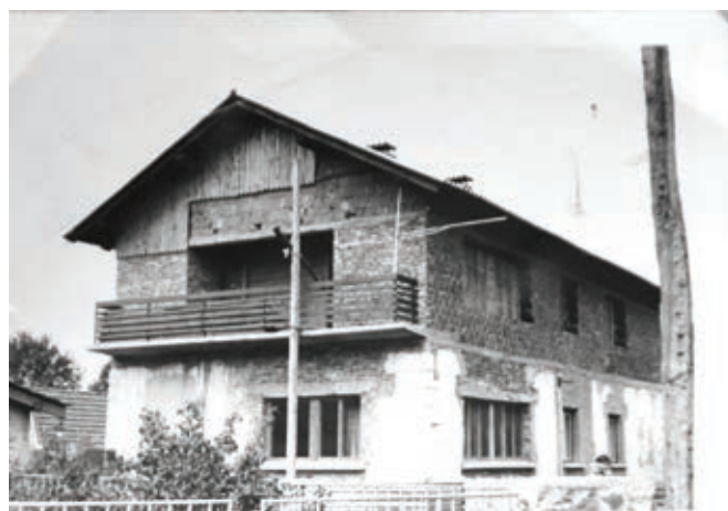
Nadgradnja šolske stavbe - izvajalec družina Potisk ...