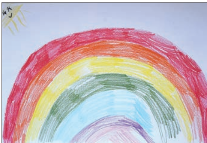
Maša Pregl, 1. b