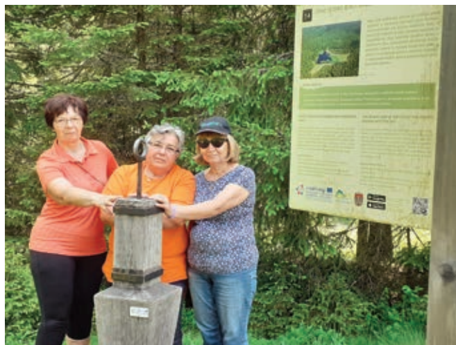
Osankarica, 23. 7. 2023

V vročem avgustu smo se šli hladiti na Roglo med smreke in na čutno pot.