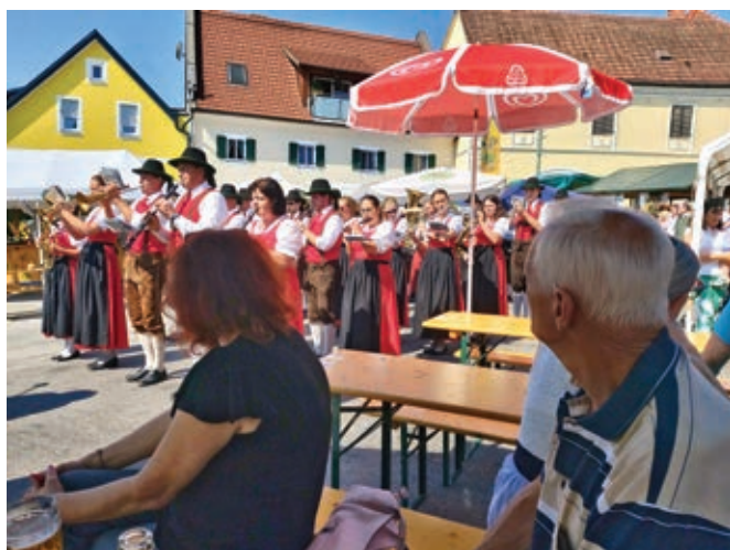
Dogodek bo ostal v lepem spominu ...