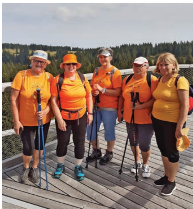
Rogla, 25. 8. 2023