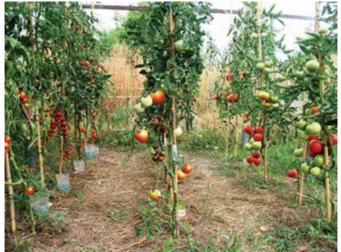
Dovolj zraka med vrstami je ključno za ohranjanje zdravja rastlin ...

Potem pa se je ozračje nenadoma izredno ogrelo, prišel je prvi vročinski val. Pa še noči so kar nekaj časa ostajale hladne. Torej nihanje temperatur, ki ga rastline iz južne Amerike ne marajo. Ponovno je sledilo zelo dolgo obdobje padavin, vendar so dnevne temperature pogosto presegle 25°C. Oslabljene rastline so zdaj rasle v pogojih, idealnih za najhujšega sovražnika razhudnikov,