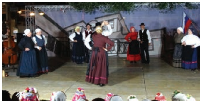
Na nastopu ...

mostana in okolice ter izvira reke Črni Drim, ki se zliva v Ohridsko jezero. Uživali smo v čudoviti in neokrnjeni naravi ter si nabirali energijo za večerno povorko po mestu in naš nastop.