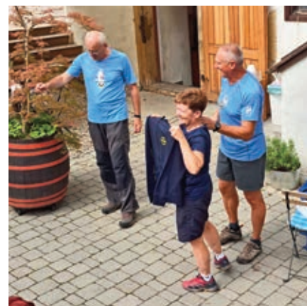
Ob podelitvi priznanj ...

(Slovar slovenskega knjižnega jezika in Planinski terminološki slovar: prečenje -a s (ê) knjiž. prečkanje : prečenje ceste / prečenje grebena; prečenje stene)