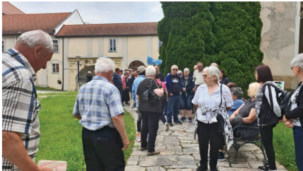
Počitek in čakanje na ogled ...

liko dobre volje in veselja se je začutilo ob počitku. Tako so prisotni ob okusni pijači tudi zapeli, da so lepe pesmi, lepi glasovi in razigranost odmevali tako v prostoru kot tudi izven.