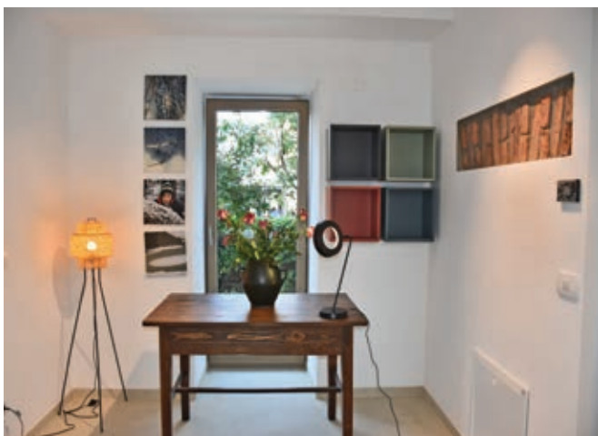
Del notranjosti ...