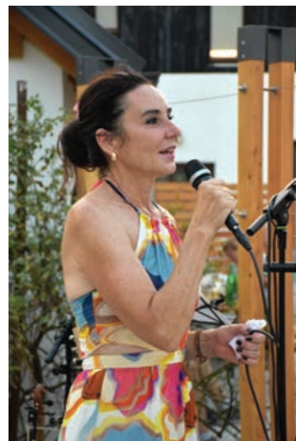
Lastnica med nagovorom prisotnim ...