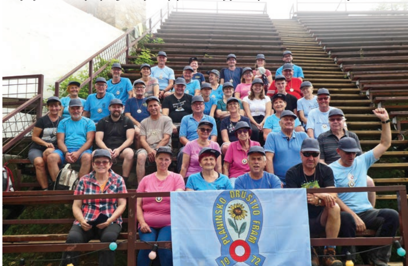
Udeleženci letošnjega pohoda ...

Za vsakega udeleženca se vodi število pohodov in vsakemu petemu pohodu sledi tudi »nagrada« v obliki priznanja, knjige, majice, flisa ... Vsak peti pohod poskušamo narediti malo poseben in poskrbimo, da vsak udeleženec takega pohoda prejme spominsko kapo ali majico. Tako je bilo tudi na zadnjem, tridesetem. Vsak udeleženec je prejel kapo z napisom 30. pohod na Vurberk, Občina Starše. Organizatorji pohoda in udeleženci se za pozornost zahvaljujemo županu Stanislavu Greifonerju.