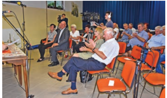
Povabljeni v dvorani KD Rošnja ...

V letu 2022 smo pridobili status pravne osebe, ki deluje v javnem interesu in nevladne organizacije v javnem interesu na področju spodbujanja razvoja turizma.