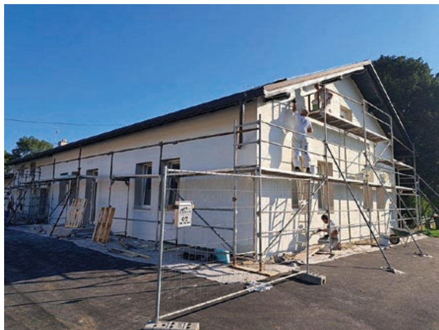
Energetska sanacija KS Prepolje ...

Čas izvedbe projektov je tudi odvisen od pridobitve vseh potrebnih dovoljenj. Tako so bile na Upravno enoto Maribor podane vloge za izdajo gradbenih dovoljenj za