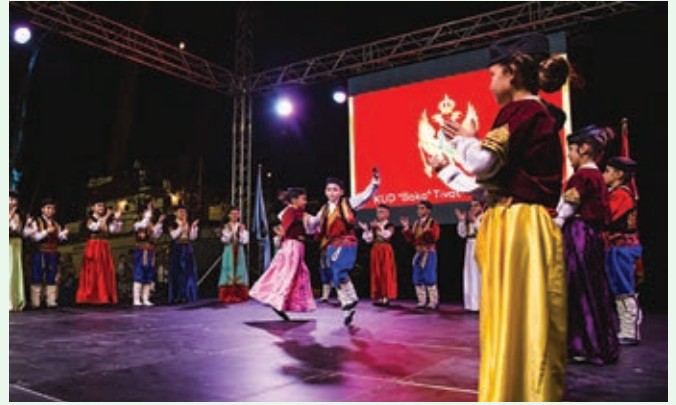
KUD BOKA ČRNA GORA