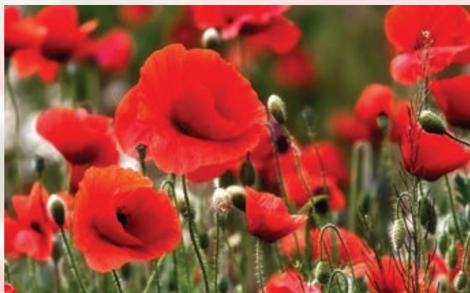
Čudovit pogled na cvetoči mak ...

Jajca ubijemo in v dve skledi previdno ločimo beljake od rumenjakov. Beljake z električnim mešalnikom stepemo v čvrst sneg. Ohlajenemu maku z metlico primešamo rumenjake, nazadnje pa nežno še beljakov sneg.