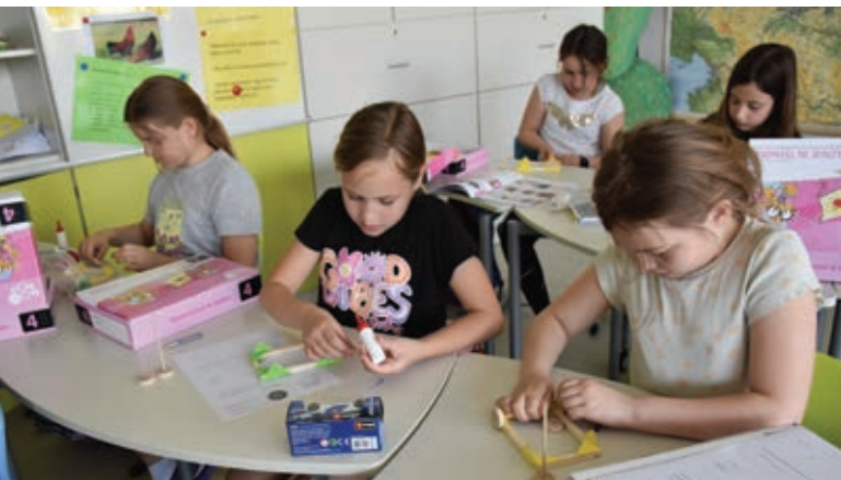
Današnji petošolci še v 4. razredu ...

Predpriprava je pomemben del učenja, saj vnaprej veš, kaj lahko pričakuješ. Pri učiteljih in sošolcih se pozanimaj, kakšen tip vprašanj bo v testu, na kateri snovi bo večji poudarek, kako dolgo bo test trajal ipd. Poleg tega je dobro vedeti, kakšen način dela ima učitelj in kaj želi od svojih učencev.