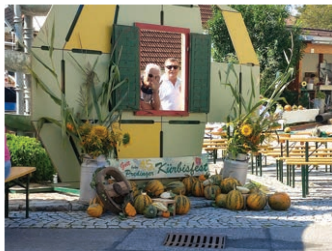
Pogled v svet - zanimiva dekoracija ...