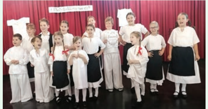
OFS KUD ŽIŠKOVIĆ