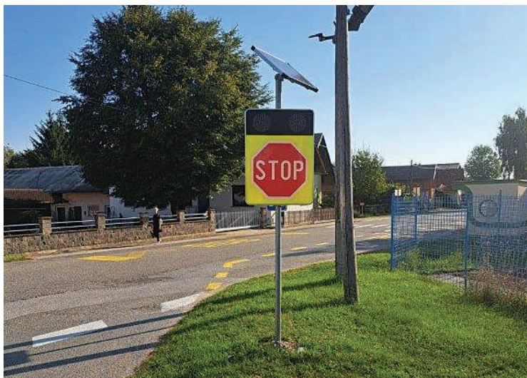
Prometna signalizacija ...