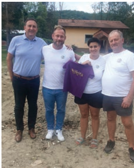
Obisk pri Pečovnikovih ...

Ta zgodba o solidarnosti je zgled tega, kaj lahko dosežemo, ko stopimo skupaj in se osredotočimo na pomoč