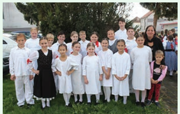
DFS KUU ZASADBREG