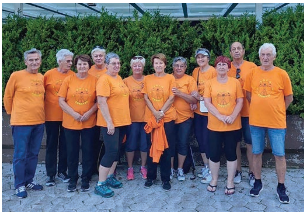
Skupina Šole zdravja iz naše občine ...