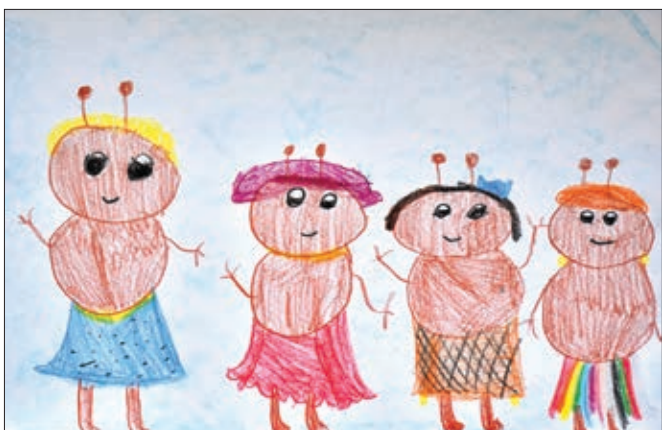
Iza Hribnik, 2. b