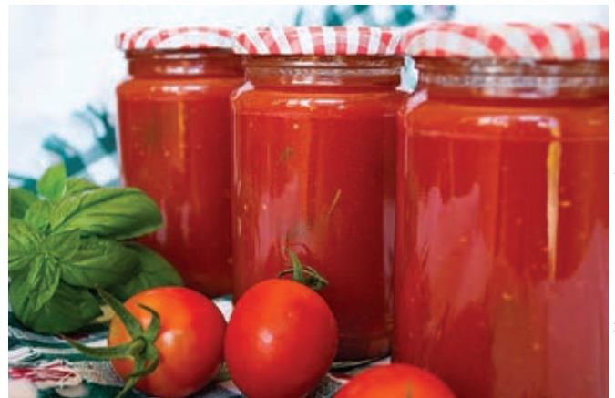
Letos smo skuhalih le malo paradižnikove omake ...