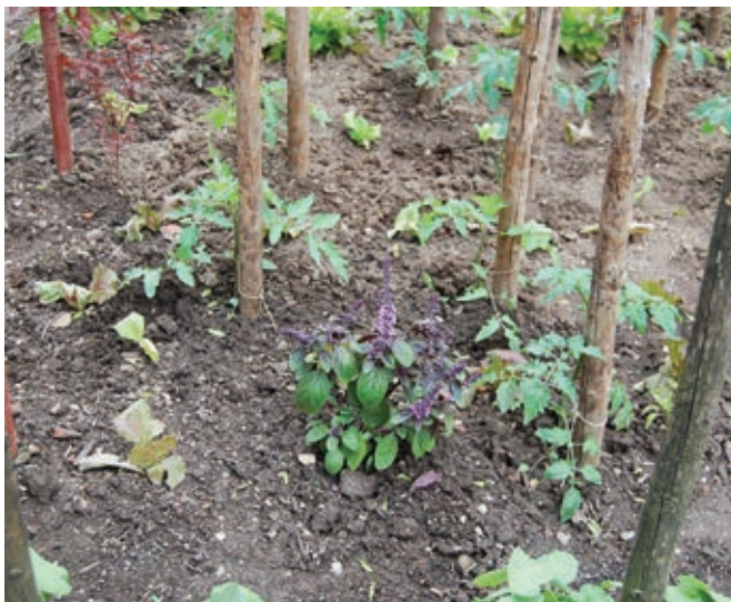
Bazilika ob paradižniku pomaga, a bi morala biti vsaj ena na dve rastlini ...

Veliko ljubiteljev vrtnarstva se ne zaveda povsem pomena, sorte, hibrida. Bolj ali manj govorijo o zgodnjih, poznih, debeloplodnih, češnjevih paradižnikih, le malo pa se jih zaveda, da je znotraj opisanega široka paleta sort, ki lahko poleg barve, oblike, velikosti in seveda okusa pomenijo tudi večjo odpornost samih rastlin.