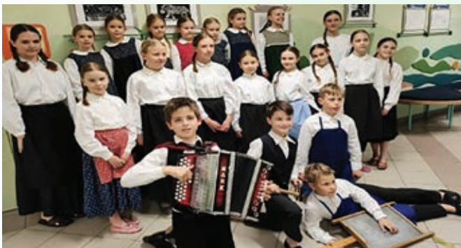
OFS OŠ STARŠE