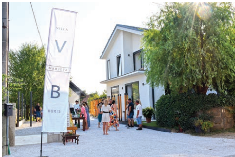
25. 8. 2023 - svečano odprtje Ville Boris v Marjeti ...