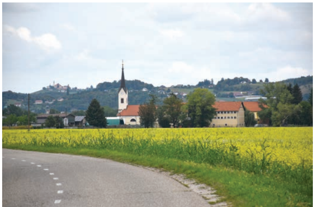
Pogled proti Staršam ...