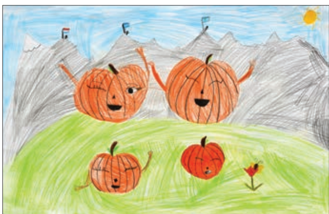
Tijana Novak, 4. b