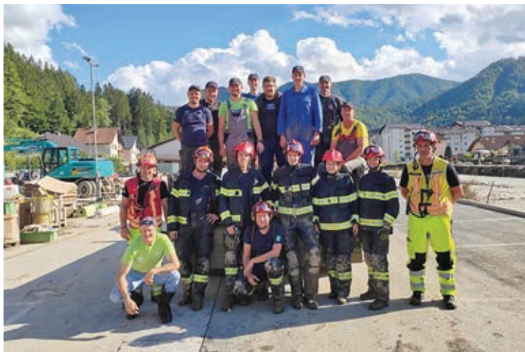
V spomin »po gasilsko« ...