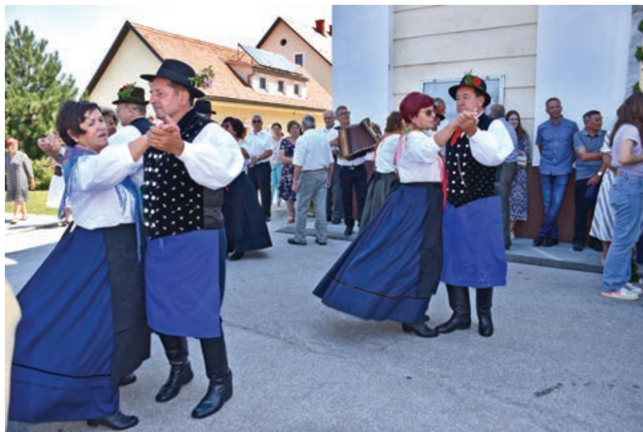
Veselo po maši - folklorna skupina iz Cirkovc...