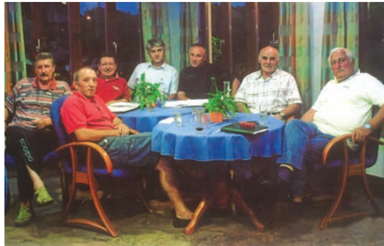
Cveto med člani Iniciative za izgradnjo Podravske avtoceste (v karirasto črtasti srajci) ...

Pri Gasilskem društvu Starše sem dolgoletni podporni član. To gasilsko društvo pokriva tudi Rošnjo in Loko. Kot predsednik KS Loka-Rošnja sem zagovarjal, da se