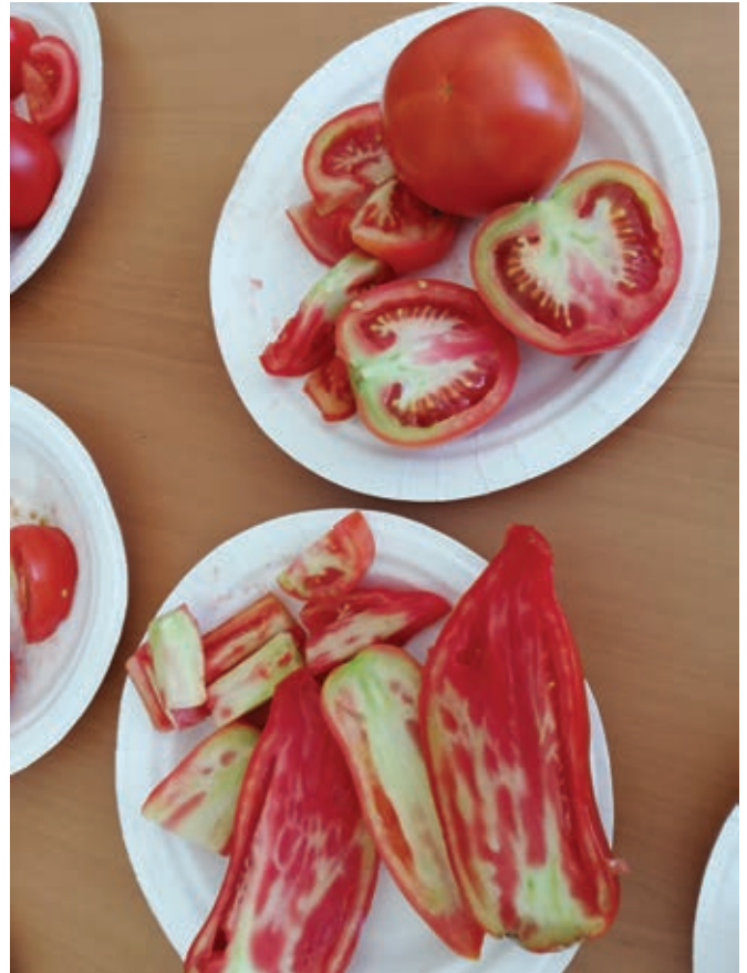
Tipičen plod paradižnika, ki je imel težave s preskrbo s kalijem ...

Med domačimi pripravki pa je v primeru najhujše nevarnosti to žajbljev čaj, preventivno pa kamilični čaj na