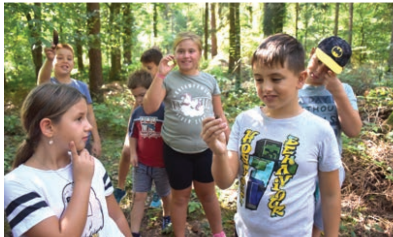
Bili smo v gozdu in raziskovali ...

Učenje je bolj produktivno in koncentracija večja, če se posvečaš različnim predmetom in ne le enemu. Sprva se lahko učiš matematiko, nato zgodovino, kasneje angleščino ipd.