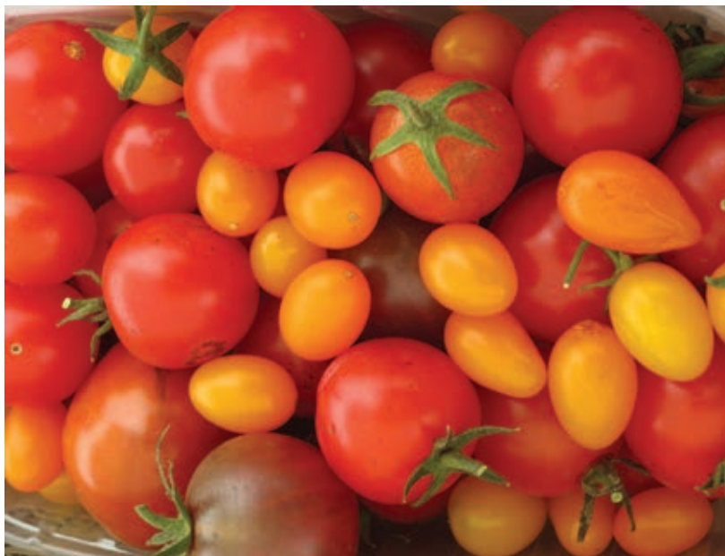
Paradižnik vseh barv je želja vsakega vrtničarja ..

Tekom leta redno odstranjujemo zalistnike, saj le-ti porablajo veliko hranil, ki bi drugače šle plodovom na