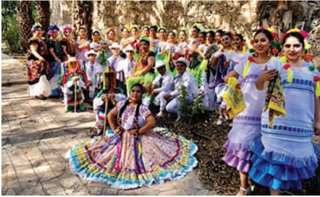
BAILANDRO FOR MEXICO MEHIKA