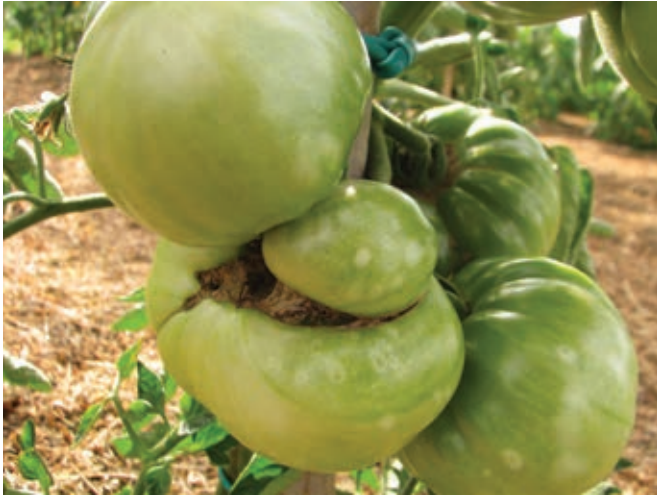
Posledice hladne pomladi prezgodnjega sajenja na prosto na prvih plodovih paradižnika ...

glavnem stebelu. Rastlina lahko počrpa samo toliko hranil, da nahrani le-te. Če ima stranska stebela, porablja zanje preveč hranil in energije in je nima več za obrambo pred boleznimi.