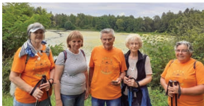
Rački ribniki, 6. 7. 2023