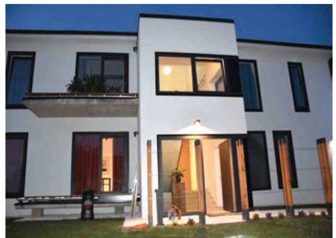
Dvoriščna stran prenovljene zgradbe v mraku ...