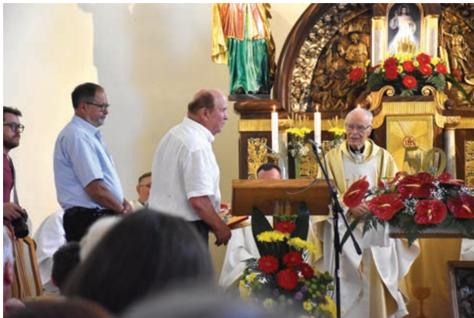
Obisk in čestitke sorodnikov ...