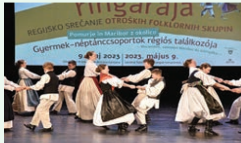
MFS KUD »ŠTUDENT MARIBOR«