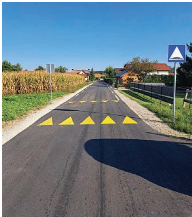
Cesta Brunšvik - Starošince ...

S stališča prometne varnosti opremljamo križišča s svetlobno prometno signalizacijo (križišče Prepolje in Trniče).