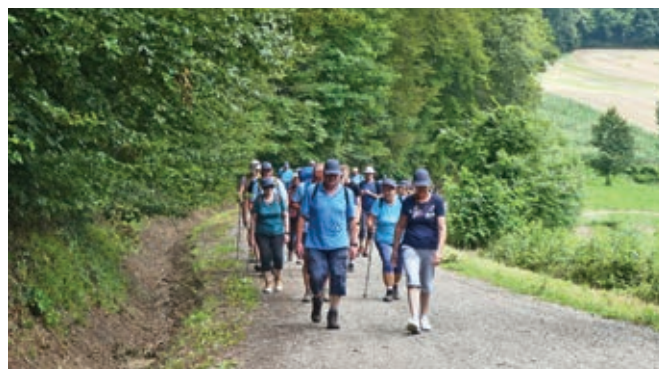
Med pohodom ...